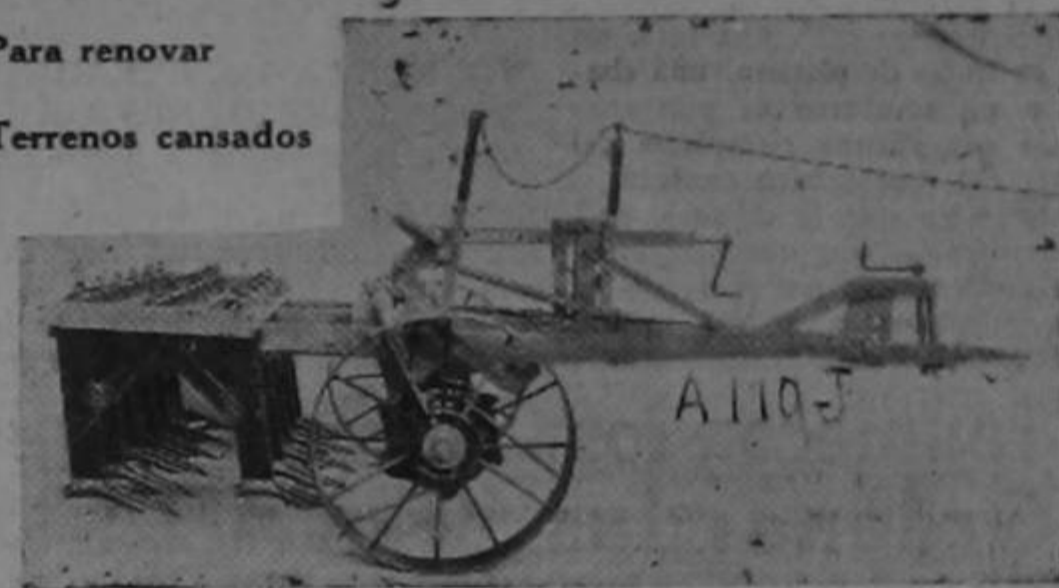
Para renovar Terrenos cansados

Excelentes arados subsueledores para tractores de 25 a 35 H.P. Casi al costo @ 2.900.00, para colaborar con los agricultores.